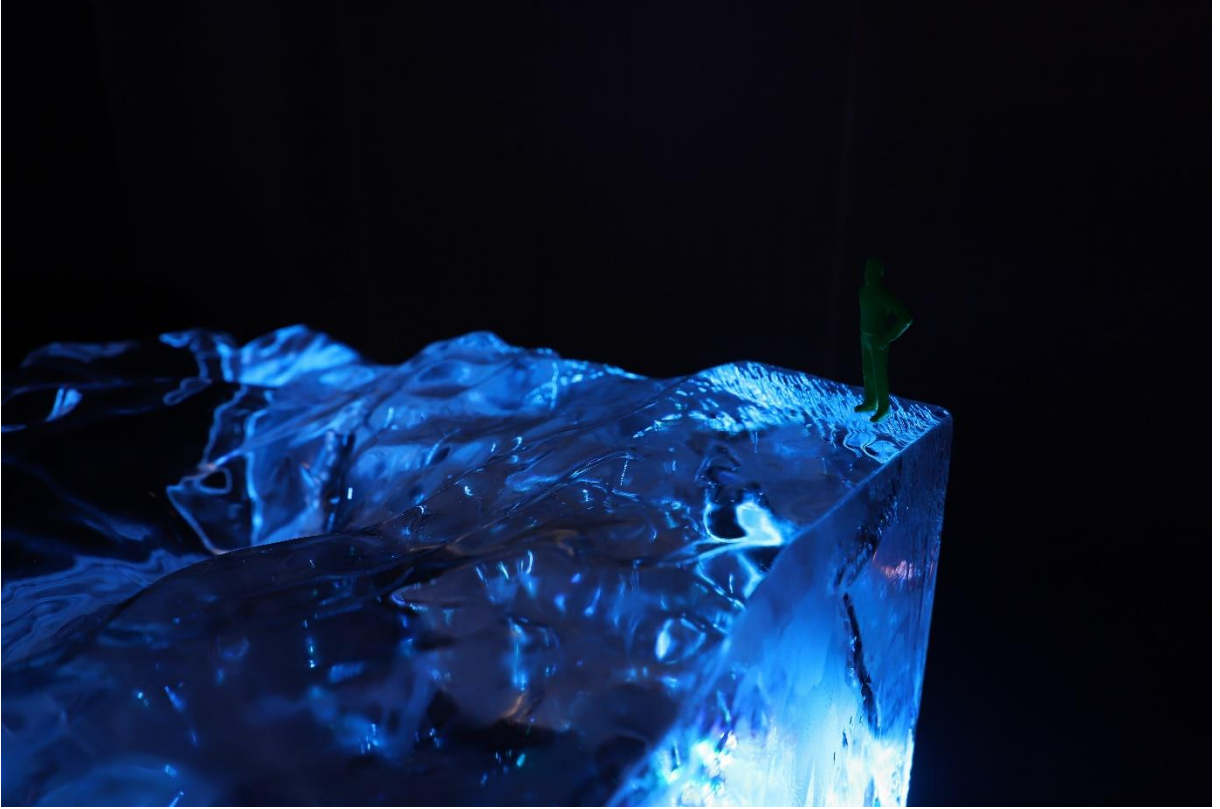
Görsel 2. “Değerlerin Başkalaşımı”, detay