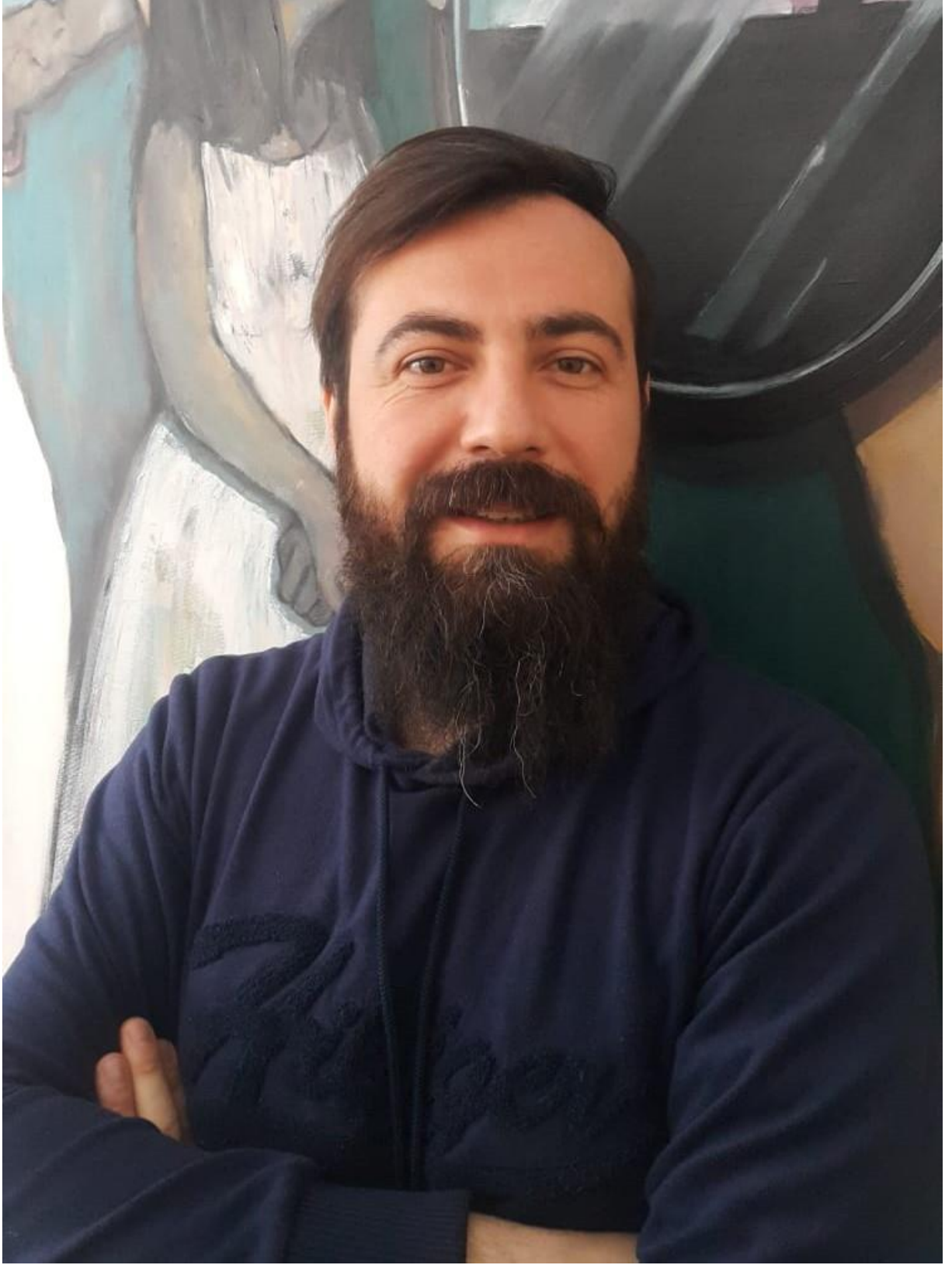
Görsel 5. Portre