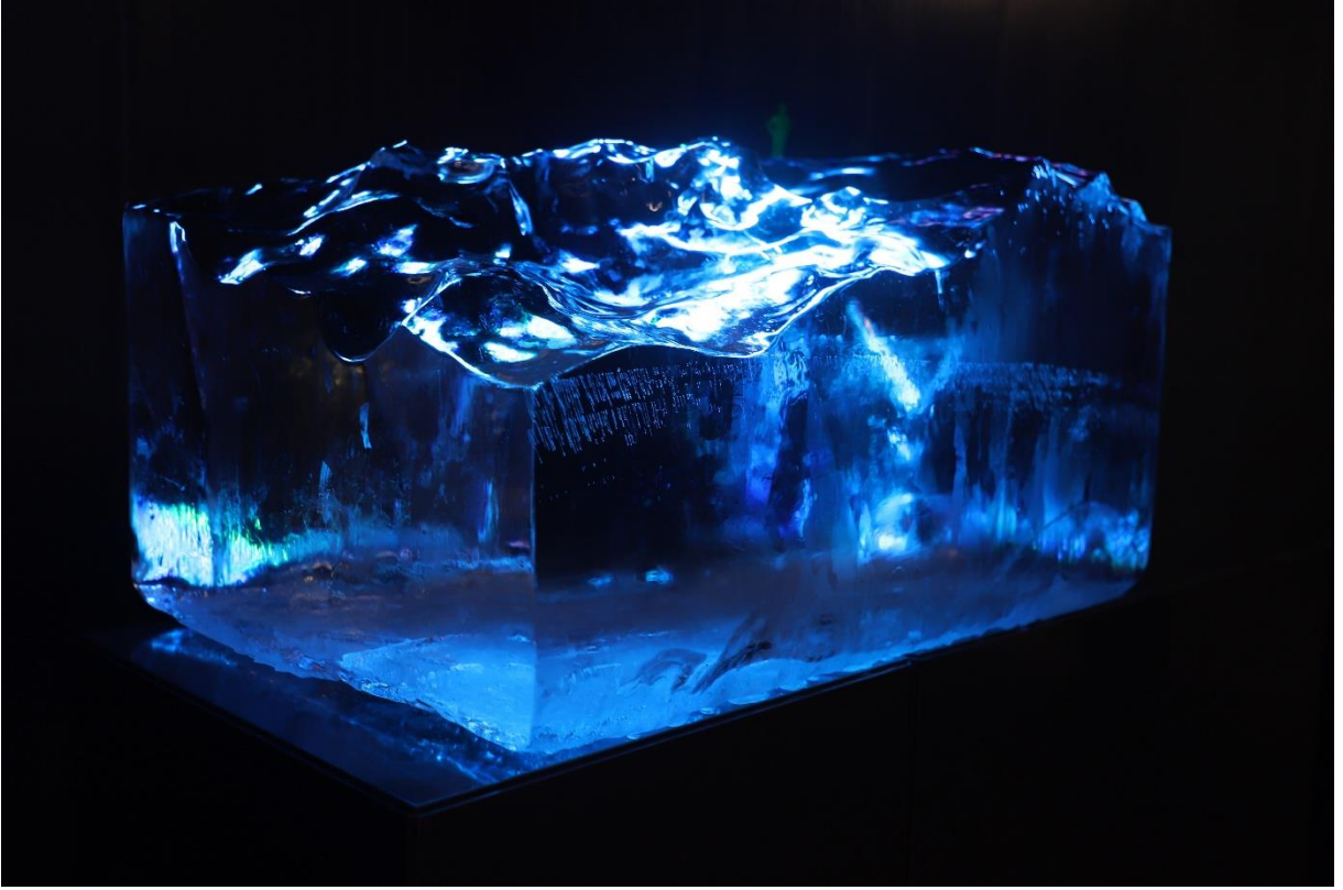
Görsel 1. “Değerlerin Başkalaşımı”, Şeffaf Blok Buz + Kompozit Malzeme, 50 x 57 x 100cm, 2021